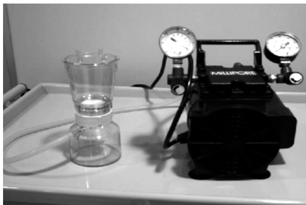
Imagen 1. Set de filtración y bomba de vacío utilizadas para control microbiológico de nutrición parenteral utilizado en método de filtración (adaptado Montejo y cols.)

gregar las mezclas de lípidos, evitando que tapen los poros de la membrana. Dado que, en este estudio, las mezclas de lípidos lograron traspasar adecuadamente la membrana y para eliminar un componente adicional de contaminación de la mezcla durante su preparación, se optó por no agregar este reactivo.